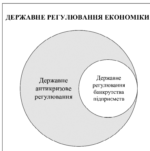
Рис. 1. Співвідношення понять державне антикризове регулювання та державне регулювання банкрутства підприємств, сформоване на основі побудови діаграми Ейлера-Венна