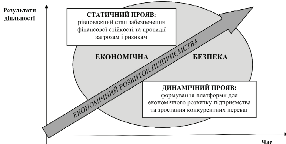
Рис. 2. Прояв дуальної природи економічної безпеки

Проведений аналіз поглядів науковців стосовно дефініції економічної безпеки свідчить про різносторонній спектр її трактування, що залежить від рівня її існування