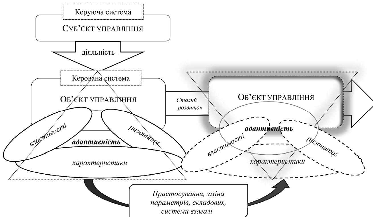
Рис. 3. Структурно-логічна схема адаптивного управління