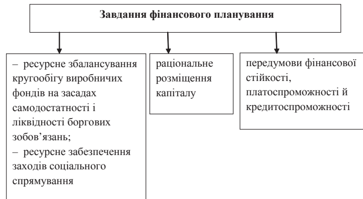
Рис. 1. Завдання фінансового планування

складових системи планування підприємства, дозволяє вирішувати такі життєво важливі завдання як ефективне управління фінансовими потоками, забезпечення збалансованості фінансових ресурсів і потреб підприємства, оптимізація управлінських рішень, мінімізація витрат тощо [12].