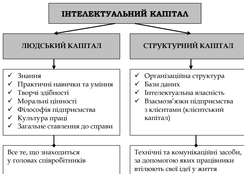
Рис. 1. Структура інтелектуального капіталу підприємства (за Л. Едвінссоном та М. Мелоуном)

У рамках функціонального підходу можна відзначити трактування, запропоноване