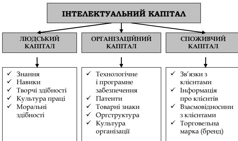
Рис. 2. Структура інтелектуального капіталу (за О. Гапоненком)

Деякі науковці стверджують, що інтелектуальний капітал є інноваційно-інформаційною складовою людського капіталу. Як зазначає С. Вовканич [3, с. 19], людський капітал не може бути підсистемою інтелектуального капіталу, бо це пов'язано з порушенням прав на отримання необхід-