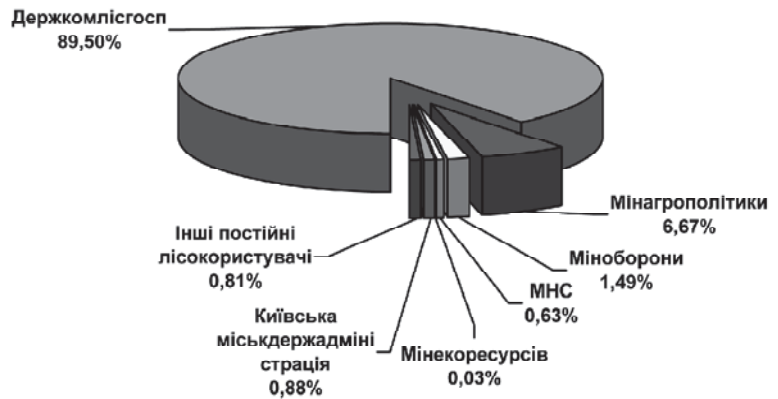
Рис. 2. Фактичний розподіл фінансування програми "Ліси України" за 2002—2009 між співвиконавцями

За виробничо-фінансовими планами регіональних підрозділів складаються по найменуванням робіт (наземна охорона від пожеж, боротьба із шкідниками та хворобами лісу,