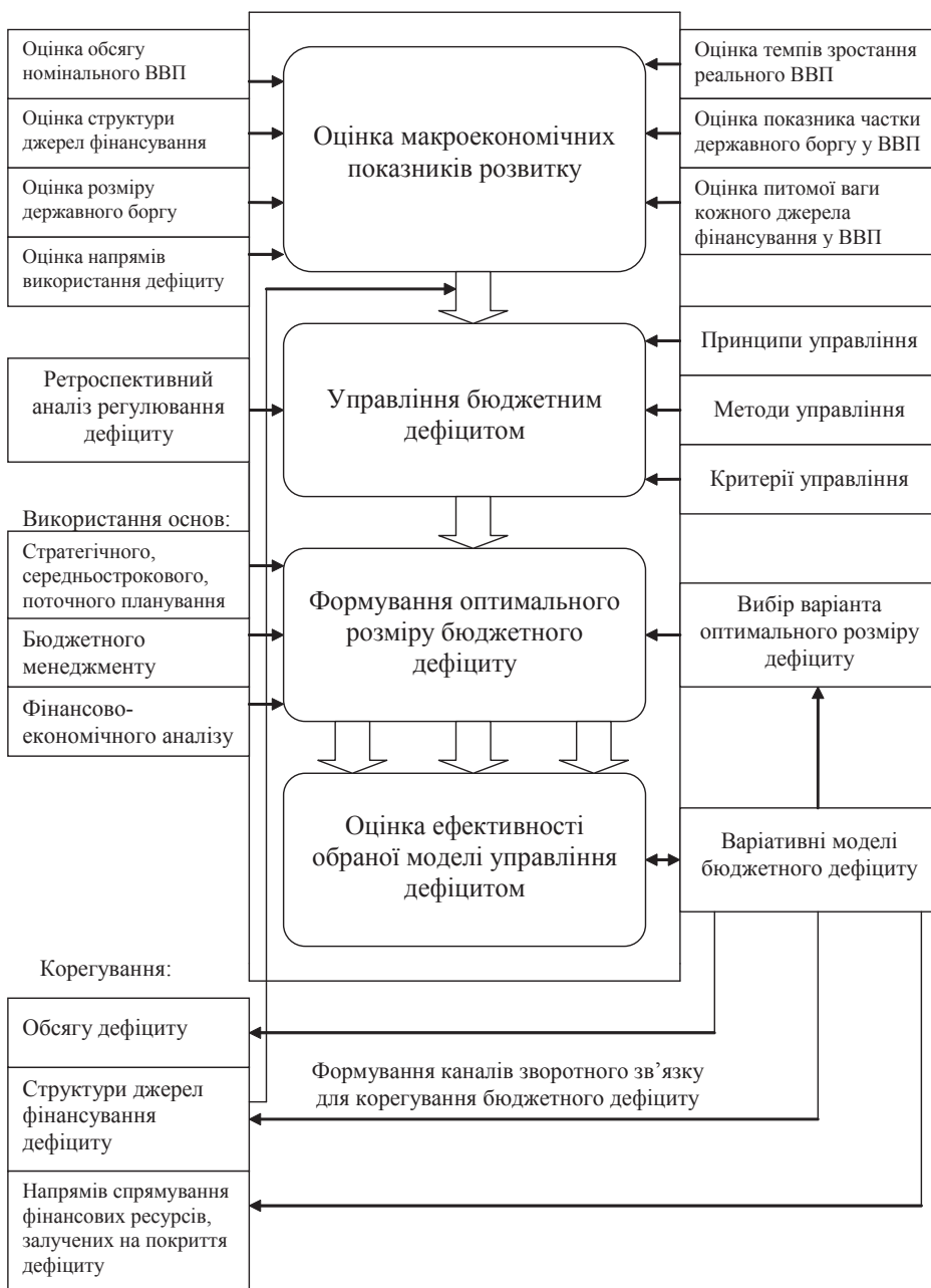
Рис. 2. Механізм управління дефіцитом бюджету

Управління бюджетним дефіцитом має відбуватися із урахуванням принципів, методів та критеріїв управління. Одним із важливих завдань сучасної бюджетної політики на середньо- та довгострокову перспективу більшості розвинених країн світу є скорочення питомої ваги державного боргу у ВВП. Про це не раз зазначалось на самітах "Великої двадцятки" у Вашингтоні, Лондоні, Пітсбургу та Сеулі у 2008—2010 роках, офіційних матеріалах міжнародних фінансових організацій. Досягнення поставленого завдання є можливим за умови бюджетної збалансованості. При цьому наявний бюджетний дефіцит у ході економічного циклу не повинен викликати зростання державного боргу вищевстановлених граничних меж, знижувати платоспроможність країни як позичальника, створювати можливі ризики дефолту та загрожувати макроекономічній стабільності країни.