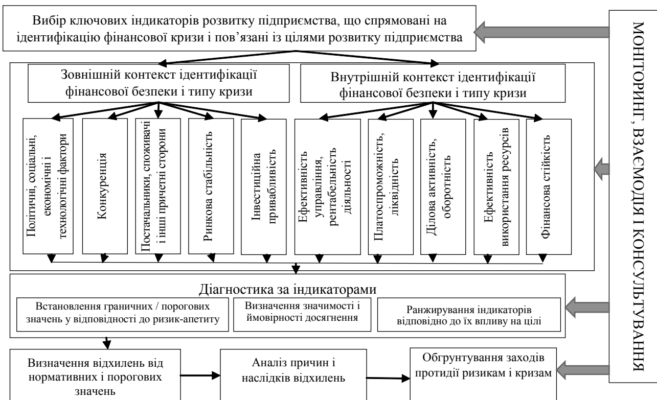
Рис. 2. Модель процесу управління фінансовою безпекою підприємства

Вибір ключових індикаторів розвитку підприємства має враховувати лише такі, котрі безпосередньо впливають на досягнення поставленої цілі і за допомогою яких можна ідентифікувати тип і передумови можливої фінансової кризи. Найкращим рішенням є поєднання критеріїв оцінки стану фінансової безпеки підприємства з цілями розвитку підприємства. Для цього під час стра-