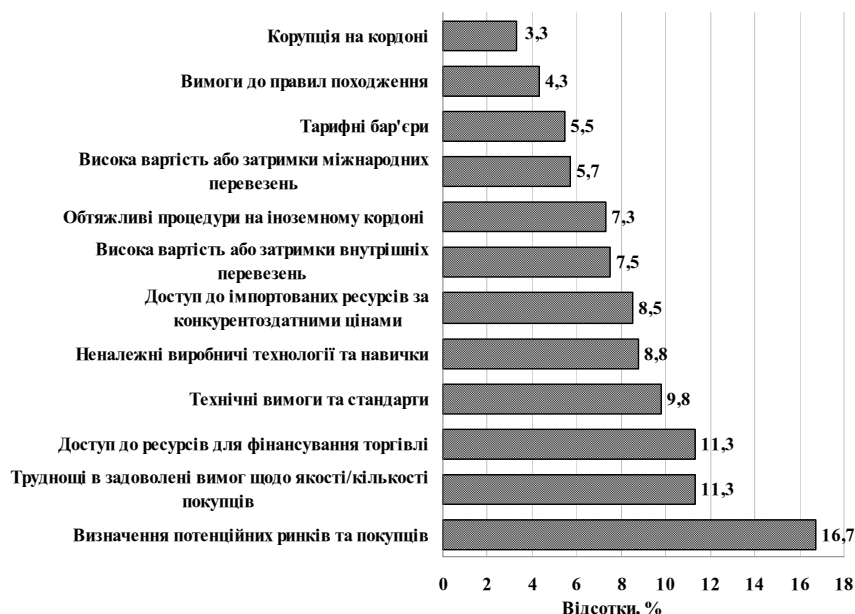
Рис. 3. Найбільш проблемні фактори, що впливають на здійснення експорту в Україні