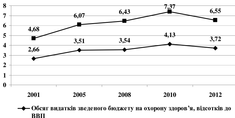
Рис. 3. Обсяг видатків зведеного бюджету на охорону здоров'я та освіту