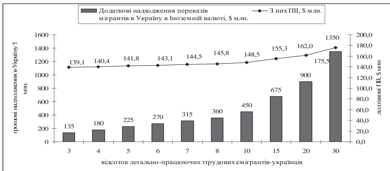
Рис. 2. Величина переказів мігрантів в Україну залежно від питомої ваги легально працевлаштованих міжнародних трудових мігрантів у їх загальній кількості

Окремого дослідження потребує економічна доцільність та обґрунтованість пропонувані заходів у рамках державного регулювання міжнародної