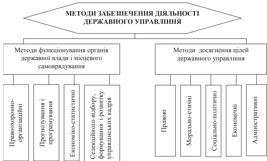
Рис. 2. Методи функціонування і забезпечення реалізації цілей державного управління

Таким чином, методологія розробляє загальні принципи створення нових пізнавальних засобів. Основним об'єктом вивчення методології є метод, його сутність і сфера функціонування, структура, взаємодія з іншими методами й елементами пізнавального інструментарію та відповідність характеру досліджуваного об'єкта, його зв'язок з пізнавальною метою чи цілями практичної діяльності. Методологія ставить перед собою завдання з'ясувати умови перетворення позитивних наукових знань про дійсність у метод подальшого пізнання цієї реальності, виявити ефективність і межі його продуктивного застосування. Це зумовлює зако-