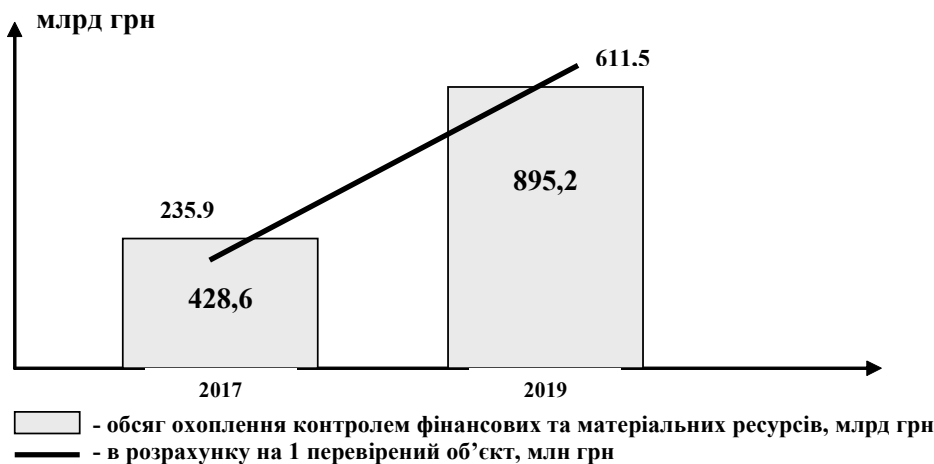
Рис. 1. Обсяги охоплення контролем фінансових та матеріальних ресурсів у 2017–2019 роках