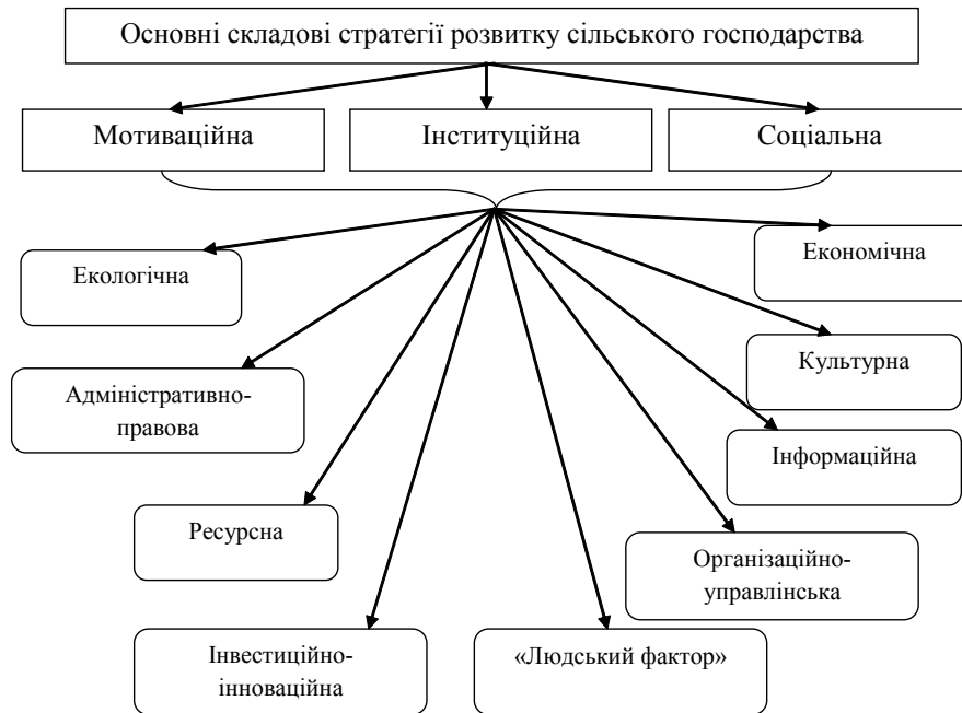
Рис. 1. Декомпозиція складових стратегій соціально-економічного розвитку сільських територій