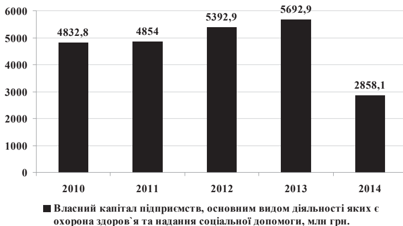
Рис. 4. Власний капітал підприємств, основним видом діяльності яких є охорона здоров'я та надання соціальної допомоги, за 2010–2014 роки

значно збільшилося у 2014 році та склало 0,7029 (рис. 3). Тому цим підприємствам дуже важливо збільшувати обсяги залучених інвестицій як іноземних, так і вітчизняних, залучати ресурси через державне фінансування та міжнародну фінансову допомогу.