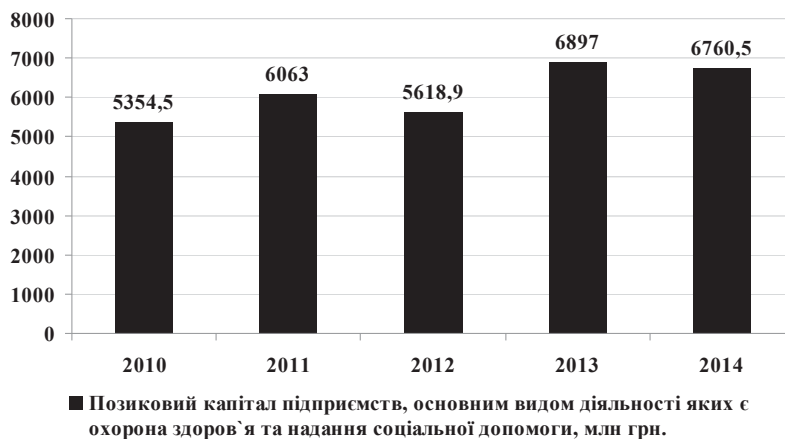
Рис. 2. Позичковий капітал підприємств, основним видом діяльності яких є охорона здоров'я та надання соціальної допомоги, за 2010–2014 роки

Відношення позичкового капіталу підприємств, основним видом діяльності яких є охорона здоров'я та надання соціальної допомоги, до їх загального капіталу