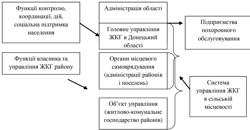
Рис. 2. Існуюча структура системи управління ЖКГ у Донецькій області

На сьогоднішній день, в регіонах склалися різні схеми адміністративного управління галуззю, починаючи від жорсткої вертикальної схеми управління і фінансування в межах регіону, і закінчуючи ситуацією, коли територіальні утворення майже повністю самостійні в питаннях ЖКГ. У Донецькій області використовують другу схему управління (рис. 2).