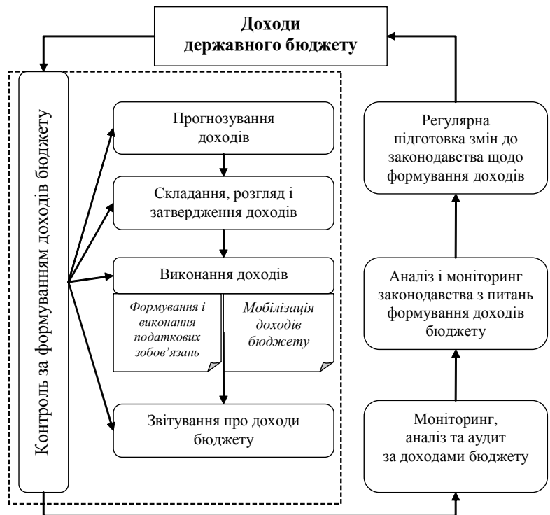
Рис. 3. Орієнтовна схема формування доходів державного бюджету

літики є складною та багатомірною. Аналіз вказує на існування трендів ВВП та фундаментальних показників бюджетного процесу що збігаються. Це можна розглядати як ознаку існування залежності. Остання виявляється через певну систему часових та структурних вимірів, входить до системи процесів більш широкого порядку. В цілому, враховуючи наявність залежності економічного зростання країни від рівня ефективності бюджетної політики, держава зобов'язана формувати та проводити таку бюджетну стратегію, яка б оптимально поєднувала національні та регіональні соціально-економічні інтереси й інтереси різних груп зацікавлених суб'єктів. Адже лише збалансований розвиток приватних і державно-регіональних інтересів має бути визначальним у бюджетній політиці, що повинна реалізовуватися з дотримання критеріїв економічної ефективності, пріоритетності формування та використання бюджету. Причому, досягнення збалансованого державного бюджету шляхом використання наявних інструментів та механізмів — є головною метою та вимогою бюджетної політики, направленої на забезпечення економічного зростання національної економіки, досягнення стабільного, довготривалого зростання економічного добробуту членів суспільства.