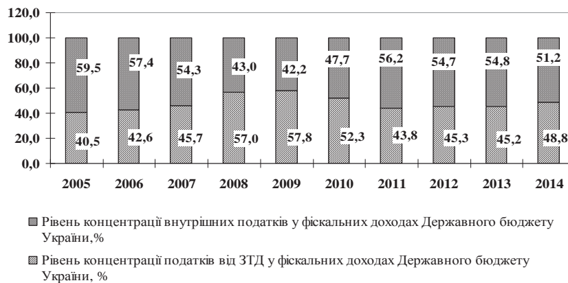
Рис. 1. Рівень концентрації податків від ЗТД та внутрішніх податків у фіскальних доходах Державного бюджету України за період 2005—2014 рр.