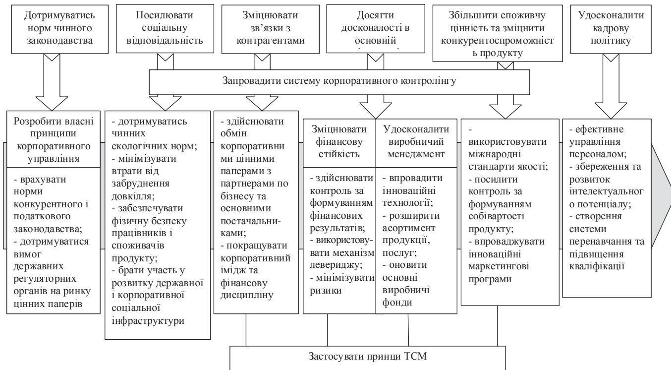
Рис. 1. Стратегічна карта нефінансової корпорації: авторська розробка

рішення проблем оцінювання діяльності підприємства. В умовах інформаційного конкурентного середовища здатність компанії розвивати, зберігати й активно використовувати нематеріальні активи стала вирішальною передумовою успіху.