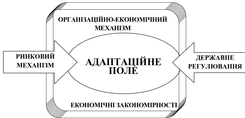
Рис. 1. Принципова схема взаємодії ОЕМ і ринкового механізму забезпечення стійкого розвитку аграрної сфери на інноваційній основі