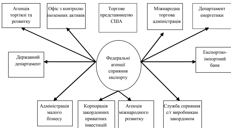
Рис. 4. Федеральні агенції сприяння експорту США

У процесі економічного розвитку не слід протиставляти ринок та державу, адже ці два механізми є найбільшим досягненням людської цивілізації. Подальший економічний розвиток можливий за умов включення суспільної відповідальності як ключового компонента моделей економічного розвитку. Формування правової держави в провідних країнах світу сприяло активному розвитку громадянського суспільства, а завдяки інформаційно-комунікаційним технологіям у процесі становлення перебуває глобальне громадянське суспільство, вплив якого посилюється не лише на глобальні економічні процеси, а й на окремі національні економіки. Саме із розгортанням глобального етапу розвитку країни отримали можливість формувати та реалізовувати постіндустріальні економічні моделі. Реалізація постіндустріальних моделей можлива за умови координації економічних процесів на глобальному рівні. Актуальними нині глобалізаційними функціями держав є