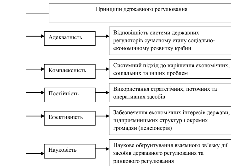
Рис. 2. Основні принципи державного регулювання в сфері пенсійного забезпечення

З початком реформування пенсійної системи України особлива увага держави приділяється розвитку недержавного пенсійного забезпечення. Необхідність і значущість розвитку недержавних пенсійних фондів (НПФ) визначається їх здатністю бути суттєвим джерелом підтримки громадян в похилому віці та одночасно акумулятором внутрішніх інвестиційних ресурсів для прискоро-