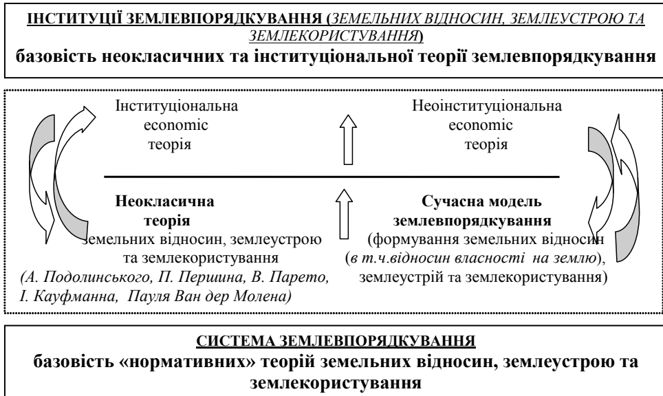
Рис. 1. Теоретичні складові зростання сутності землевпорядкування від "Системи" до "Інституції" (гіпотеза дослідження)

вих шкіл [5]. Формуючи філософську платформу розбудови інституціонально-поведінкової теорії землеустрою та землевпорядкування, ми врахували і сучасні тенденції практики та фундаментальні напрацювання наукових шкіл, які досліджують землеустрій та землевпорядкування від "замкнутої" інформаційно-технічної системи до вагомого явища національних та глобальних соціально-економічних просторів.