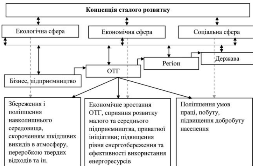
Рис. 1. Концепція сталого розвитку ОТГ

Варто зазначити, що всі етапи процесу розробки стратегії є важливими, де досягнення успіху діяльності ОТГ є можливим за правильною організації процесу, оскільки процес, який від самого початку організований належним чином і чітко виконаний на всіх етапах, принесе належний результат. Однак стратегічне управління розвитком ОТГ рідко починається з послідовно встановлених кроків. Характерною особливістю такого управління, зумовленого потребою розв'язати стратегічні проблеми, є те, що не обов'язково досягати повної згоди стосовно цілей, щоб узгодити подальші дії [18, с. 166]. Вирішальним завданнями на першому етапі розроблення успішної стратегії є аналіз стартових умов,