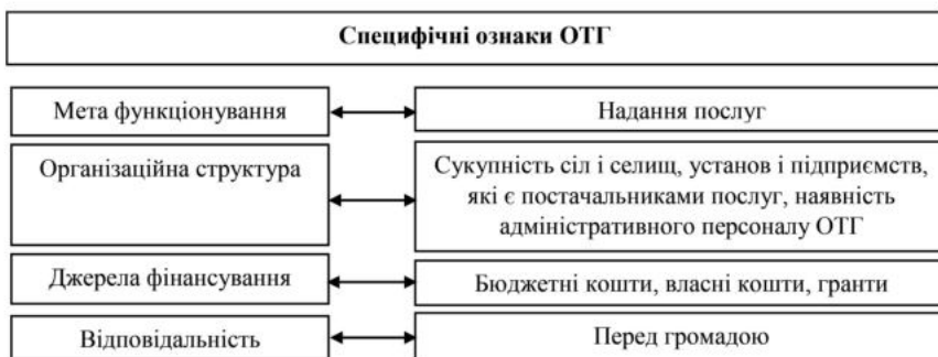
Рис. 2. Специфічні ознаки ОТГ

Джерело: сформовано на основі джерела: [12, с. 39].