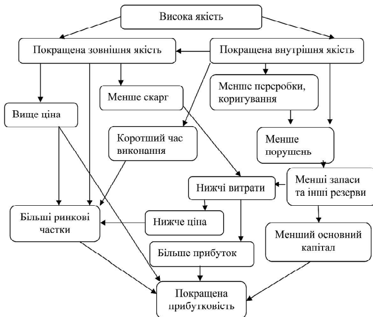
Рис. 1. Зв'язок між покращеною якістю та рентабельністю банківської системи

Основний внесок цього дослідження у науку можна принципово узагальнити так: розроблення теоретичної бази, яка охоплює фактори, що впливають на досконалість якості обслуговування в банківській системі. Підприємства, що виробляють якісну продукцію, платять більше за ці продукти і отримують більший прибуток. Управління якістю дає стратегічні переваги, як-от: зниження виробничих витрат у довгостроковій перспективі та підвищення продуктивності праці. Зв'язок між