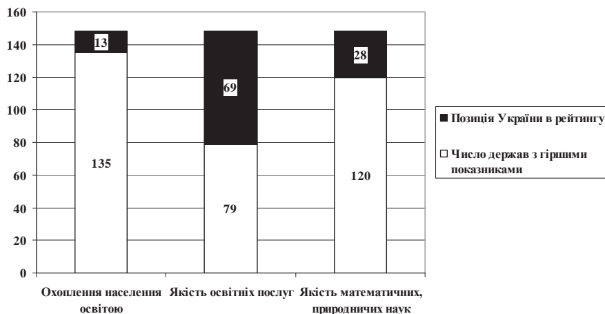
Рис. 3. Рейтинг України за окремими складовими індексу конкурентоспроможності у 2013—2014 рр.

Запропонована методика оцінки рівня економічної безпеки Комісією ООН має суттєві недоліки, оскільки не враховує такі важливі індикатори, як демографічна, зовнішньоекономічна, інвестиційна, інноваційна складові, що знижує та практично унеможлиблює її застосування в Україні. Її можна лише використовувати в контексті порівняння основних показників в Україні з іншими високорозвиненими країнами ЄС та світу.