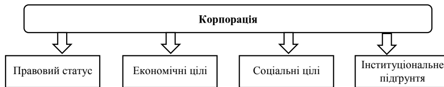
Рис. 1. Сутнісні ознаки корпорації