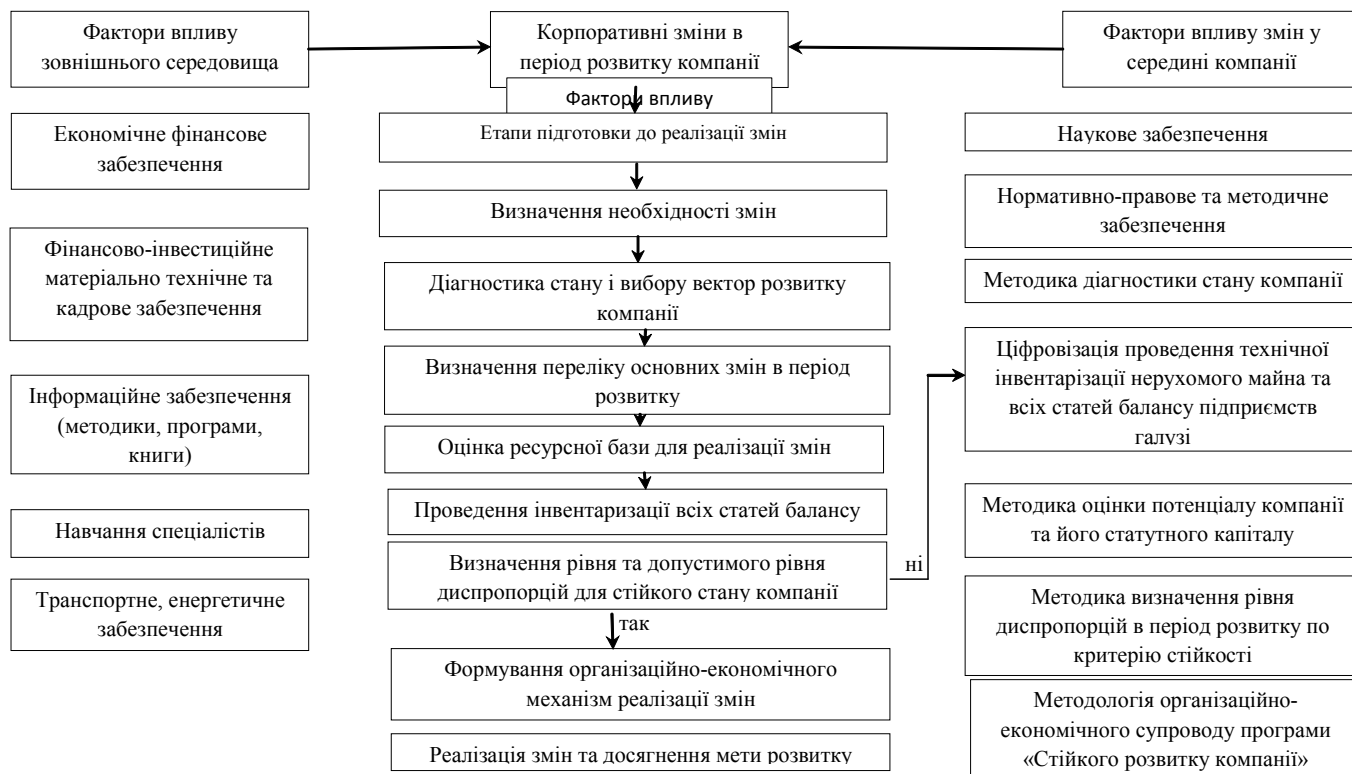
Рис. 2. Організаційно-економічний модуль реалізації корпоративних змін програми "Стійкого розвитку підприємства"

Методологія даної роботи була розроблена, затверджена та впроваджена на підприємствах "Укрзалізниця" у 2007, 2010, та у 2013 роках [11] для чіткого визначення кількості, якості, вартості, об'єктів нерухомого майна, постановки їх на облік (чи списання та вилучення з об-