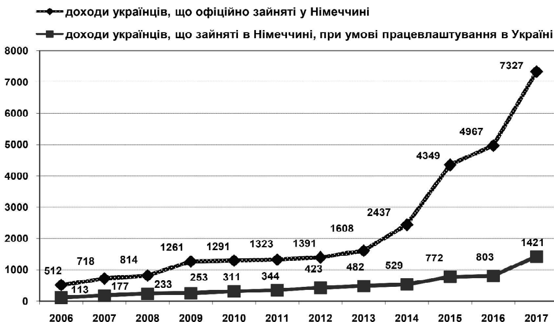
Рис. 2. Динаміка рівня доходів зайнятих українців у Німеччині та розрахунковий обсяг доходів українців зайнятих у Німеччині за умови працевлаштування в Україні у 2006—2017 рр.

Очевидно, що такі значні розриви в рівнях доходів між українською та німецькою частинами територіальних суспільних систем стали однією з головних причин інтенсифікації процесу переливання людських ресурсів в україно-німецькому міграційному каналі та призвели до формування УНТМС. Наслідком функціонування УНТМС стало покращення економічної ситуації осіб-переселенців та сімей трудових мігрантів через зростан-