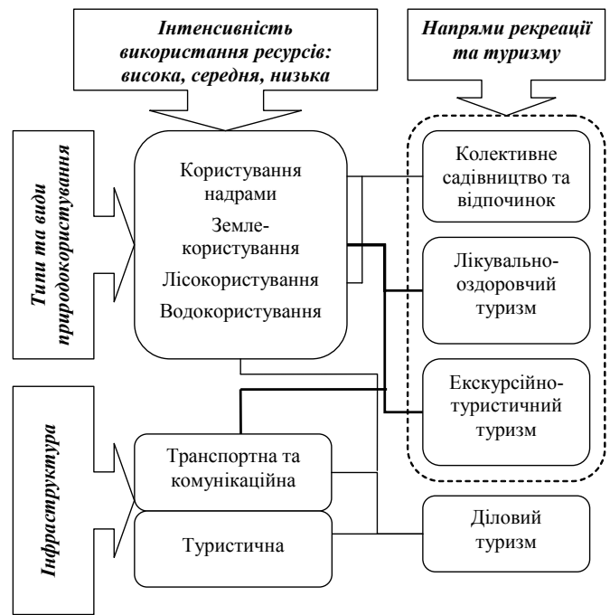
Рис. 1. Структура рекреаційно-туристичного природокористування

До основних типів територіальних рекреаційно-туристичних систем відносять лікувальну, оздоровчу, спортивну та пізнавальну. Для визначення типу тери-