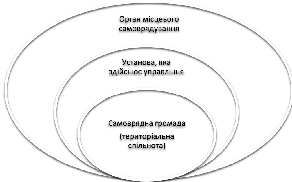
Рис. 1. Підходи до розуміння поняття "муніципалітет"