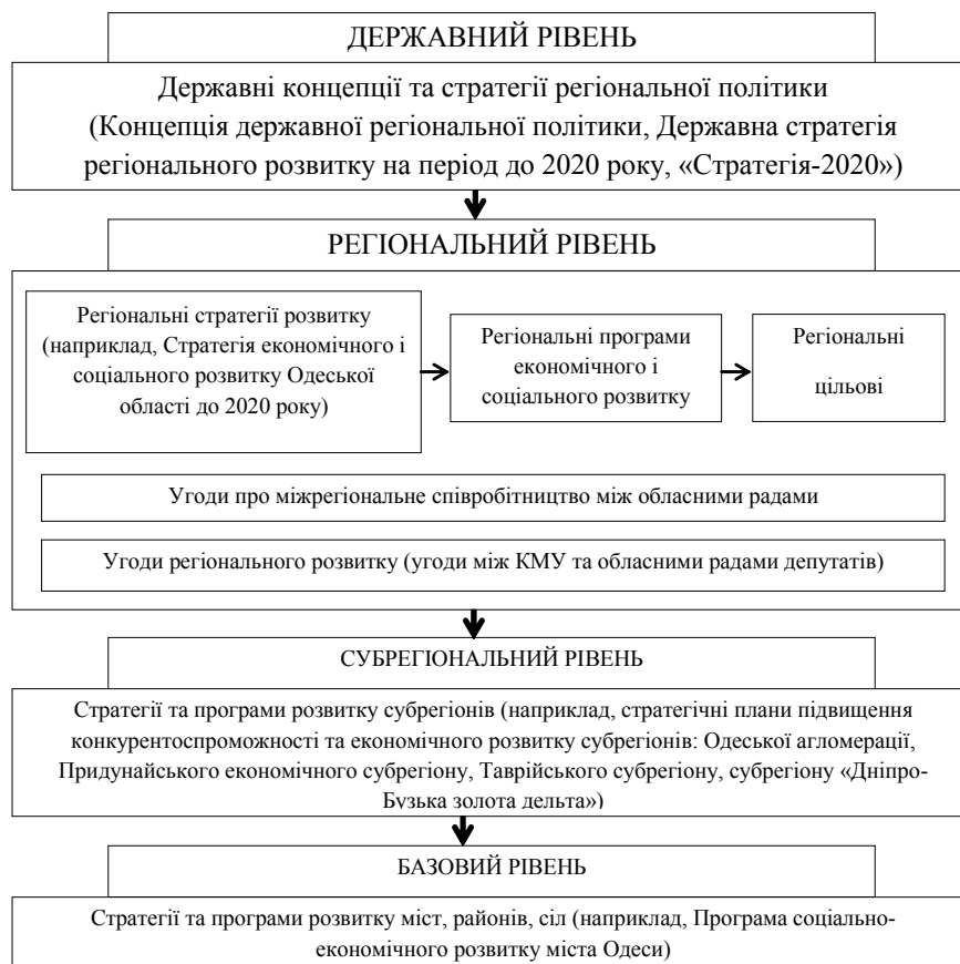
Рис. 1. Система стратегічного планування регіонального розвитку в Україні