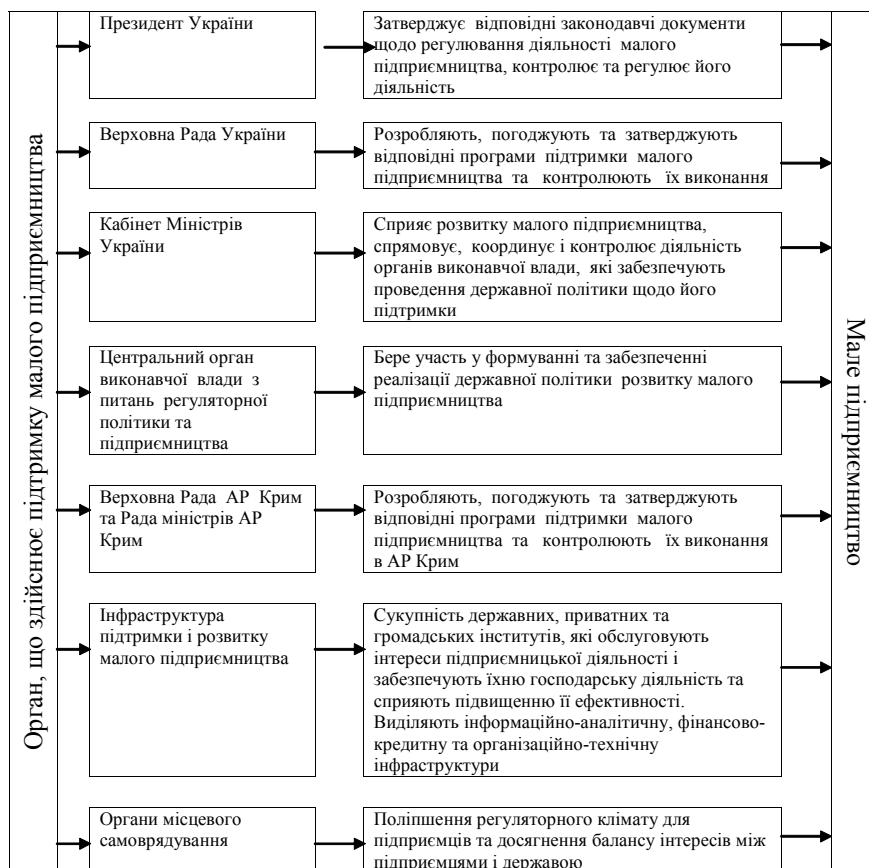
Рис. 1. Структура здійснення державної підтримки малого підприємництва в Україні [2]

ництва" [2] відображені напрями щодо підтримки малого підприємництва, такі як: