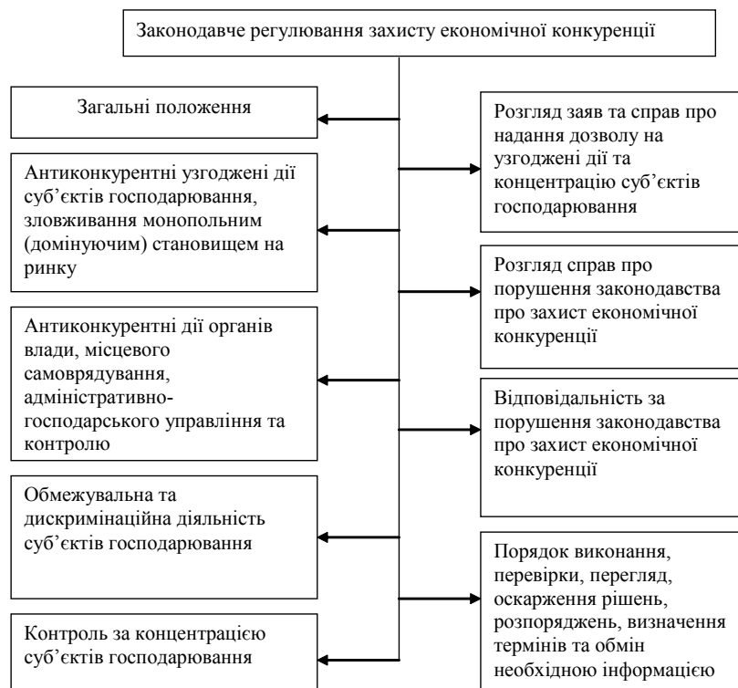
Рис. 1. Законодавче регулювання захисту економічної конкуренції

Джерело: складено автором на основі: [2, с. 26—29; 6, с. 120—125].