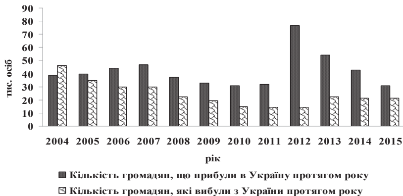
Рис. 1. Динаміка міграційних процесів в Україні