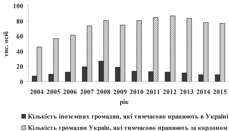
Рис. 2. Динаміка трудової міграції в Україні

Водночас, і аналізуючи динаміку балансу трудової міграції, варто відмітити той факт, що Україна є значним нетто-експортером трудових ресурсів (рис. 2). Також не може не привертати увагу той факт, що при щорічному зростанні числа іноземних громадян, що прибувають в Україну, згідно з офіційними статистичними даними Державної служби зайнятості, кількість