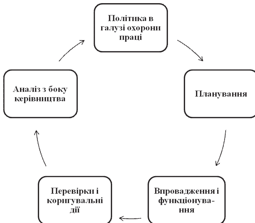
Рис. 2. Елементи системи управління охороною праці на підприємстві

Створення безпечних і здорових умов праці забезпечується шляхом впровадження системи організації охорони праці на виробничому рівні. Закон "Про охорону праці" містить окремий розділ, присвячений організації охорони праці та її управлінню на підприємствах, в установах, організаціях.