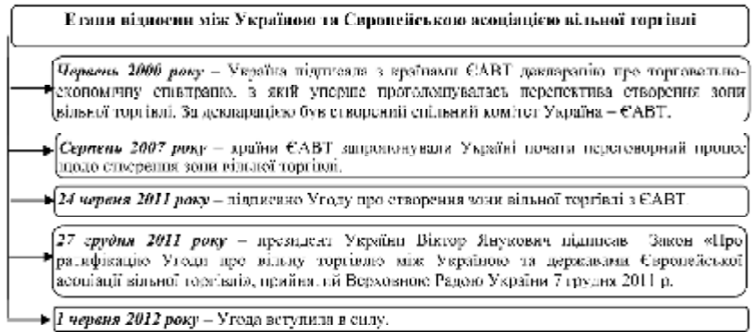
Рис. 2. Етапи відносин між Україною та Європейською асоціацією вільної торгівлі

Навіть незважаючи, що за результатами 2012 року український експорт до США у порівнянні з 2011 роком впав на 8,9% або на -99,1 млн дол. та склав 1014,7 млн дол., а імпорт американської продукції до України за результатами 2012 року у порівнянні з 2011 роком зріс на 10,8% або на 314 млн дол. та склав 2905,2 млн дол., економіка Сполучених Штатів Америки є одним із ви-