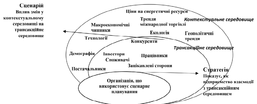
Рис. 2. Роль контекстного середовища в сценарному плануванні за методологією Оксфорда

Сценарії — це набір прикладів і можливих варіантів майбутнього, необхідних для побудови стратегій для ухвалення майбутніх рішень менеджментом компанії. Сценарії містять в основному якісний опис, але й використовуються окремі кількісні оцінки для визначення найбільш імовірних сценаріїв розвитку. Кожен сценарій описує те, як різні елементи можуть взаємодіяти за певних умов. І хоча межі сценарію часом можуть бути нечіткими, спроба розробити детальний та реалістичний опис майбутнього може спрямувати увагу компанії на аспекти, які вона раніше не помічала. Наприклад, використовуючи підхід Оксфорда [4] до планування сценаріїв, важливо розрізнити безпосередніх суб'єктів, із якими ведеться бізнес (транзакційне середовище) та ризоманітні фактори у більшому контекстальному середовищі (рис. 2). Контекстуальні фактори перебувають поза впливом організації. Сценарне планування в цьому випадку полягає передусім у дослідженні того, як контекстуальні фактори можуть вплинути на організацію.