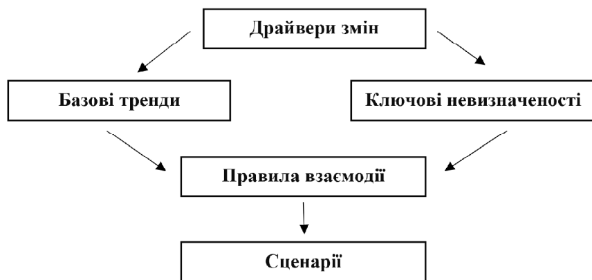
Рис. 4. Блоки сценарного планування з урахуванням правил взаємодії

Чим більше контролювати тенденцію, тим швидше вона може зникнути. Тому ми вважаємо необхідним управлінським рішенням вибудовувати елементи сценарію не лише з точки зору тенденцій та невизначеностей, але й з точки зору правил взаємодії в галузі, які можуть змінитися. Тому третій сценарій "Блакитний океан" передбачає