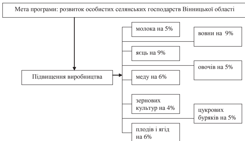
Рис. 2. Цілі програми розвитку селянських господарств Вінницької області

розвиток сфери послуг: транспортних, зв'язку, торгівлі, служби побу-ту, відпочинково-розважальних та інших.