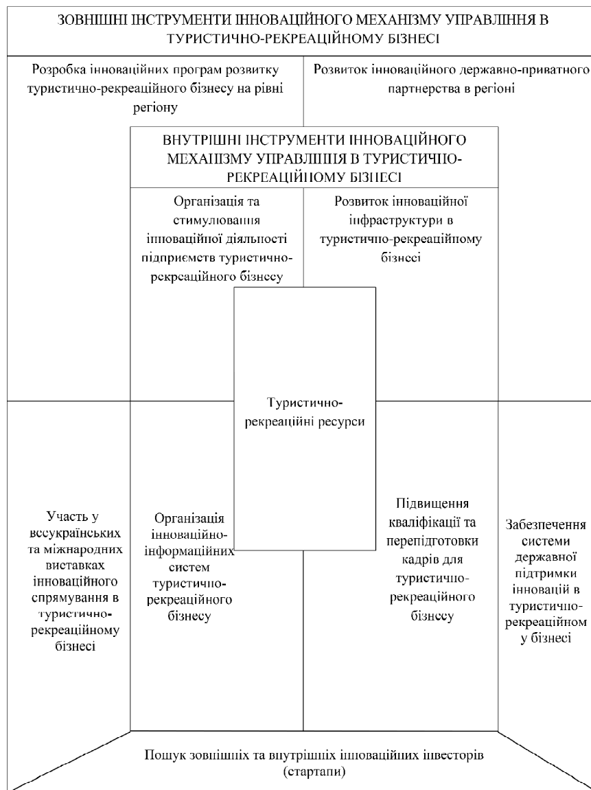
Рис. 1. Інноваційний механізм управління в туристично-рекреаційному бізнесі