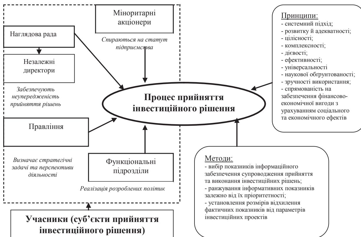
Рис. 3. Механізм прийняття інвестиційних рішень

Особливості прийняття інвестиційних рішень на підприємствах залізничного транспорту України визначаються монополізацією та державним регулюванням, згідно із законом "Про залізничний транспорт" [7]: з метою забезпечення державних і суспільних інтересів, свободи підприємництва і формування ринку транспортних послуг, безпеки перевезень, захисту навколишнього природного середовища Кабінет Міністрів України визначає умови і порядок організації діяльності залізничного транспорту загального користування, сприяє його пріоритетному розвитку, надає підтримку в задоволенні потреб залізниць у рухомому складі, матеріально-технічних і паливно-енергетичних ресурсах. Розви-