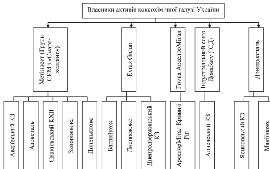
Рис. 1. Власники активів коксохімічної промисловості України

Майже половину всього обсягу виробленої коксохімічної продукції забезпечується групою Метінвест. Група Метінвест — міжнародна вертикально інтегрована