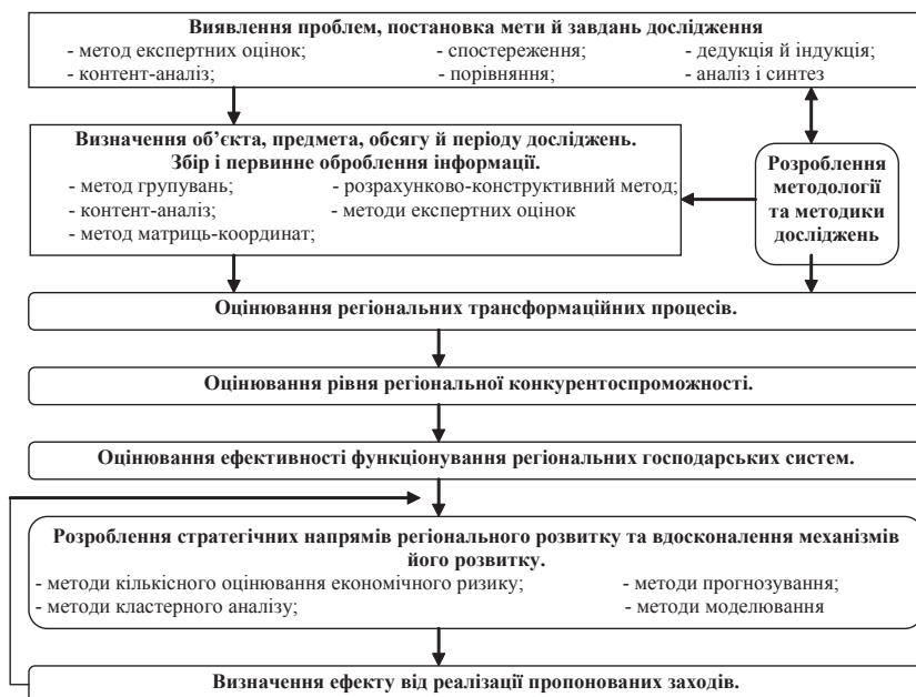
Рис. 1. Алгоритм і система методів дослідження регіональних економічних систем [7]

терії оцінки результатів дослідження тощо [7].